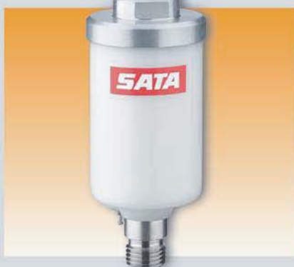
Мини влагоотделитель Арт. 9878