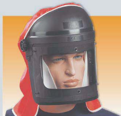
Sata Vision 2000 Профессиональная респираторная система Арт. 69500