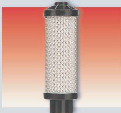
Картридж полипропиленовых микроволокон для фильтров тонкой очистки серий 0/434, 0/444 и 0/494 Арт. 81810