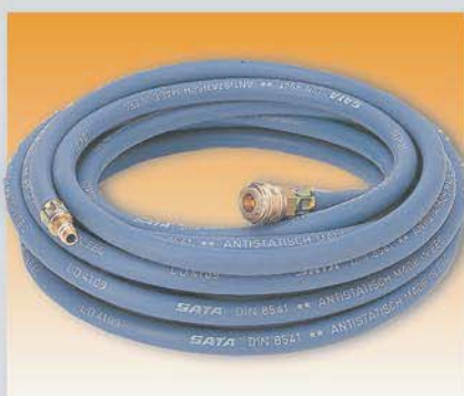
Шланг с внутренним диаметром 9мм длиной 10метров быстросъемными переходниками стойкий к растворителям Арт. 53090