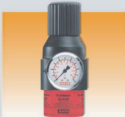
Регулятор давления 0/420 0-10 бар (15-150psi) Арт. 92288