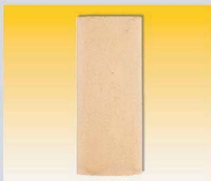
Картридж из высокопористой бронзы для фильтров с фильтрацией частиц 5 микрон для влагоотделителей серий 0/414, 0/424 и 0/444 Арт. 22160