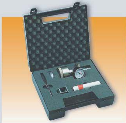
Набор для проверки давления воздуха и выставления оптимального значения Арт. 7096