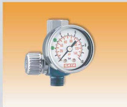
Манометр Арт. 27771